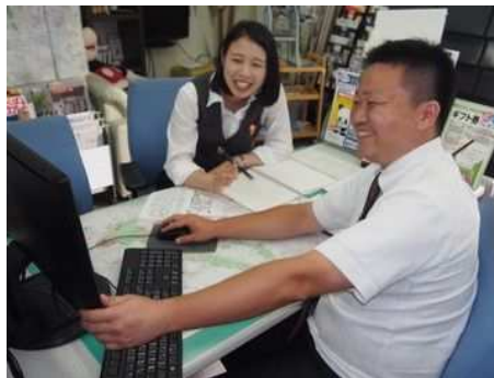
その場で思ったことや感じたことは積極的に言うことで、成長スピードも上がります!

アポイントがない日には、つくば市の情報を知るためにポスティング作業をお願いします。「〇〇枚配り終わるまで帰って来な!」なんてことはないので、ご安心ください(笑)。