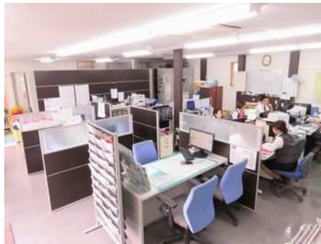
忙しい仕事ですがやりがいを感じながら働けます!

扱う物件もお客様もその日の業務量も実に様々。多岐に渡る仕事なので決して簡単ではありませんが、やりがいは十分! まずは出来ることから始めてください。