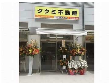
昨年BVI内に支店1店舗目がオープン! きれいな職場です☆